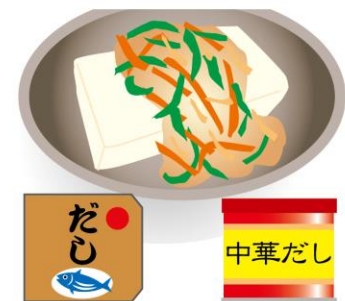
野菜のあんかけは、和風、中華どちらのだしベースでも合いますよ！

立派なおかずとして活かすのも良いですよ！そのなかでも、豆腐のボリュームを活かす、豆腐ステーキのアレンジをご紹介します。 豆腐ステーキのつくり方：豆腐（めん、絹、どちらでもOK）をよく水切りして適当な大きさに切り、片栗粉をまぶして焼く ここにいろいろ合わせていきま す。 水溶き片栗粉で仕上げるあんかけは、バリエーションもいろいろ！ ・きのこを炒め、和風だしと合わせ たあん ・中華だしにかにかまぼこ、溶き卵を入れたあん ・にんじんや玉ねぎの細切り、もやしなどを使ったあん。野菜は、冷蔵