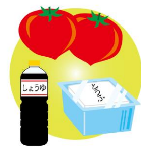
材料、調味料、炒め時間などは、

庫の余りものでOKです。 あんかけ以外にも…… ・豆腐ステーキを耐熱皿に並べて市販のトマトソースをかけ、とろけるチーズをのせてトースターで焼く ・豆腐ステーキの焼く前のものを活かすのもおすすめ。 ・水切りした豆腐に片栗粉をまぶし、豚バラ肉を巻いて焼くと、ボリュームのある一品に。