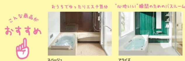
おうちでゆったりエステ気分 “心地いい”瞬間のための「スルム」 スパーズ アライズ